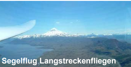
Segelflug Langstreckenfliegen über den Anden