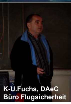
K-U.Fuchs, DAeC Büro Flugsicherheit