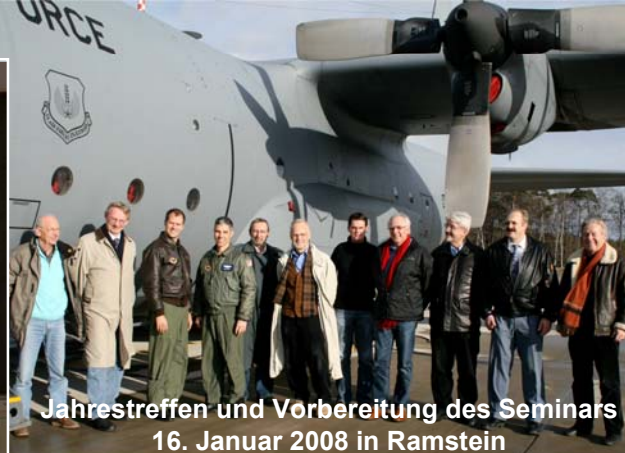
Jahrestreffen und Vorbereitung des Seminars 16. Januar 2008 in Ramstein