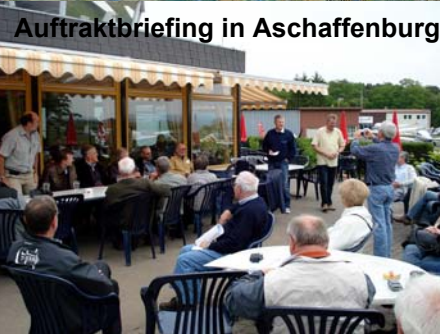
Auftraktbriefing in Aschaffenburg