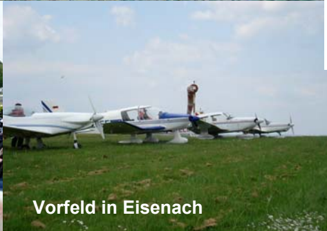
Vorfeld in Eisenach