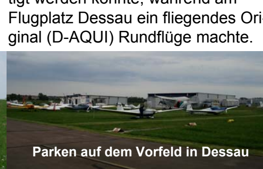
Parken auf dem Vorfeld in Dessau