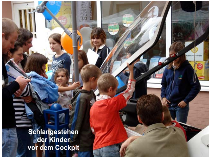
Schlangestehen der Kinder vor dem Cockpit