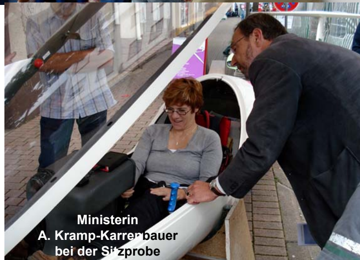
Ministerin A. Kramp-Karrenbauer bei der Sitzprobe